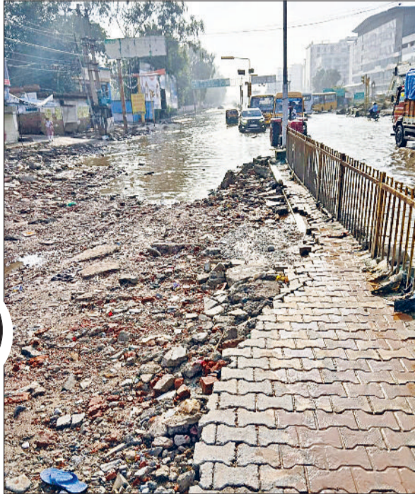
रेवाड़ी। सोहना रोड पर तोड़ा गया हरियाणा का रैंप व रेवाड़ी। सोहना रोड पर तोड़ा गया रैंप व गुजरते वाहन।