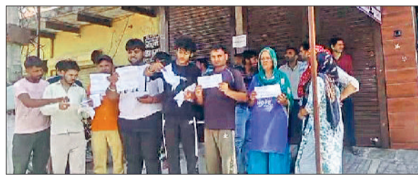
रेवाड़ी। दुकान के बाहर सामान बुक की रसीद दिखाते लोग व दुकानदार का फोटो दिखाते लोग।

प्रतिशत व 12 दिन पहले पूरे पैसे जमा कराने पर 50 प्रतिशत डिस्काउंट देने की बात कही गई थी। लोगों के अनुसार कि धंधा जमाने के लिए दो बार लोगों को सस्ते में भी सामान दिया गया। सामान बुक करते