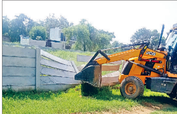
रेवाड़ी। अवैध कॉलोनी का निर्माण तोड़ती जेसीबी व अवैध कॉलोनी का निर्माण तोड़ती जेसीबी।