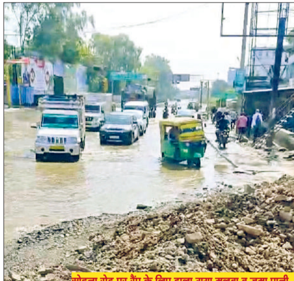
सोहना रोड पर रैंप के लिए डाला गया मलबा व जमा पानी