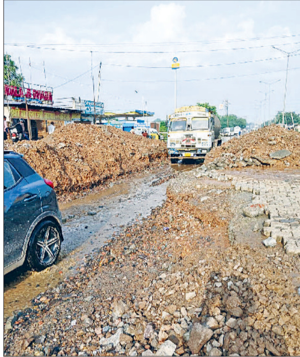
रेवाड़ी। सोहना रोड पर तोड़ा गया हरियाणा का रैंप व रेवाड़ी। सोहना रोड पर तोड़ा गया रैंप व गुजरते वाहन।