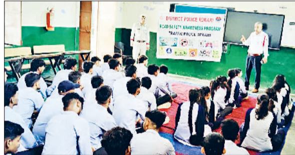
रेवाड़ी। विद्यार्थियों को ट्रैफिक नियमों की जानकारी देती पुलिस।

ट्रैफिक पुलिस की ओर से लोगों को ट्रैफिक नियमों के प्रति जागरूक करने के लिए जागरूकता अभियान चलाए जा रहे हैं। मंगलवार को ट्रैफिक पुलिस ने सैंसोरियम पब्लिक स्कूल, गवर्नमेंट सीनियर सैकेंडरी स्कूल धारूहेड़ा व बिठवाना में शिक्षकों व विद्यार्थियों को ट्रैफिक नियमों सहित नशे के दुष्प्रभावों व समय पर चालान भरने के प्रति जागरूक किया। पुलिस ने विद्यार्थियों को दोपहिया वाहन चलाते समय हेलमेट लगाने, रॉन्ग साइड ड्राइविंग न करने, वाहन चलते समय मोबाइल फोन का इस्तेमाल न करने व नशीले पदार्थों का सेवन न करने की सलाह दी। उन्होंने शिक्षकों व अभिभावकों को नाबालिग बच्चों को टू और फोर व्हीलर गाड़ी न चलाने देने की भी हिदायत दी। कार्यक्रम में सभी