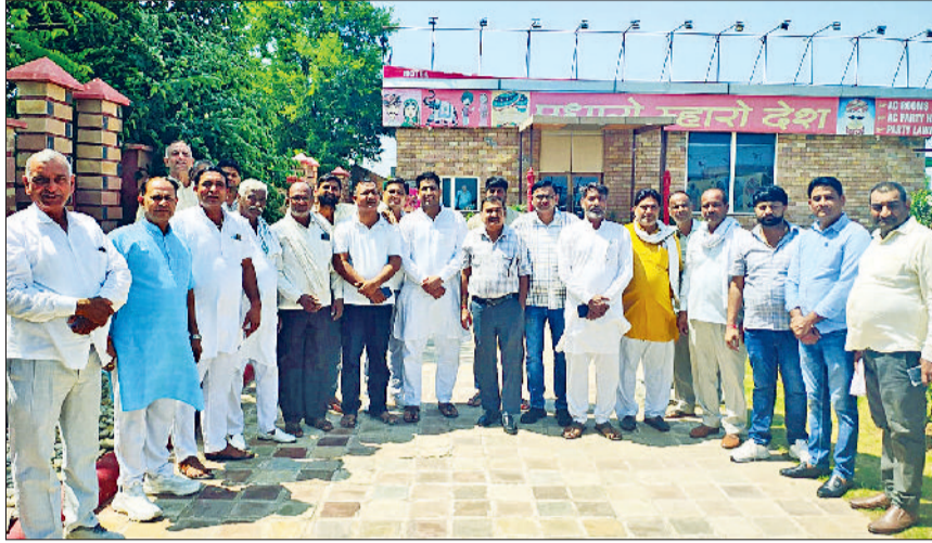
रेवाड़ी। पंचायत में मौजूद खोल खंड के प्रतिनिधि।