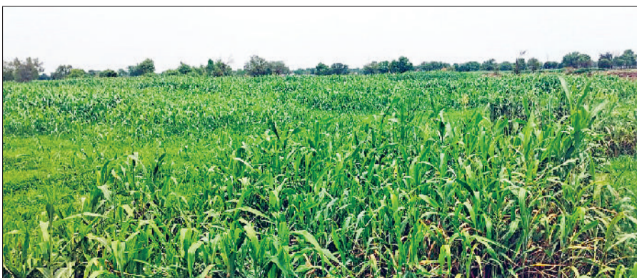
रेवाड़ी। एक खेत में बाजरे की फसल से छाई हरियाली।

दो दिन बाद सावन माह दस्तक दे रहा है। इससे पूर्व मानसून की बरसात तो हुई है, परंतु अभी अच्छी बरसात का इंतजार खत्म नहीं हुआ है। आसमान साफ होते ही भारी उमस लोगों का जमकर पसीना निकालने लगती है। मौसम में बार-बार बदलाव देखने को मिला रहा है। 9 जुलाई से तीन-चार दिन तक अच्छी बारिश होने की उम्मीद है, जिससे सावन माह की शुरूआत झड़ी लगने से हो सकती है।