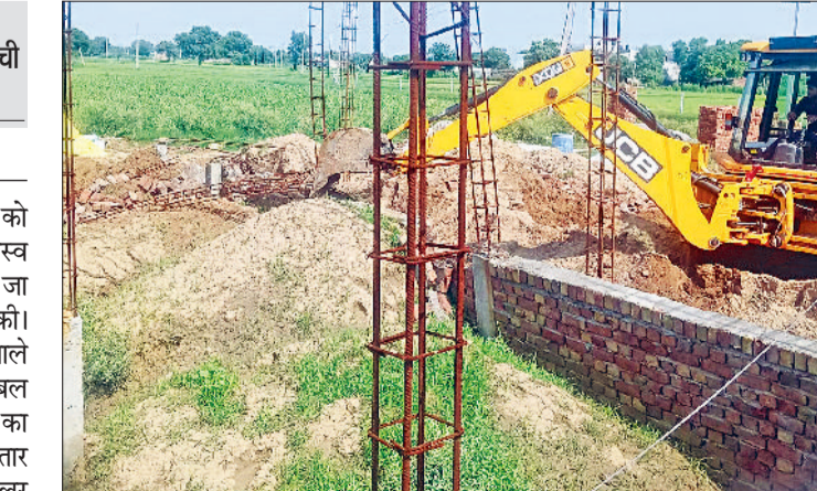
रेवाड़ी। अवैध कॉलोनी का निर्माण तोड़ती जेसीबी व अवैध कॉलोनी का निर्माण तोड़ती जेसीबी।

डीटीपी विभाग की टीम ने मंगलवार को गढ़ी बोलनी रोड व धारुहेड़ा की राजस्व सीमा में अवैध रूप से विकसित की जा रही कॉलोनी पर तोड़फोड़ की कार्रवाई की। डीटीपी की कार्रवाई से प्लॉटिंग करने वाले लोगों में खलबली मची हुई है। पुलिसबल की मौजूदगी में डीटीपी की कार्रवाई का कहीं विरोध नहीं हुआ। डीटीपी की लगातार कार्रवाई के बाद भी कॉलोनाइजर व डीलर नई कॉलोनियां विकसित करने में लगे हुए हैं। डीटीपी के निर्देश पर मंगलवार को पुलिसबल व ड्यूटी मजिस्ट्रेट के साथ टीम गढ़ी बोलनी रोड स्थित गांव डवाना के पास पहुंची। जहां डीटीपी की टीम ने करीब 3 एकड़ जमीन पर विकसित की जा रही अवैध कॉलोनी का ध्वस्त कर दिया। टीम ने 18 डीपीपी, 8 चारदिवारी को जमींदोज कर दिया। इसके अलावा डीटीपी की टीम ने धारुहेड़ा क्षेत्र में गांव पांचौर की राजस्व सीमा में अवैध कॉलोनी पर कार्रवाई की। टीम ने गांव पांचौर में 3 एकड़ में विकसित