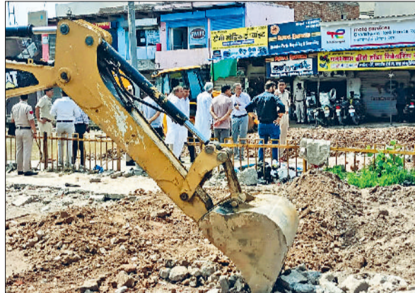
रेवाड़ी। सोहना रोड पर रैंप तोड़ने के बाद मौजूद जिला प्रशासन।