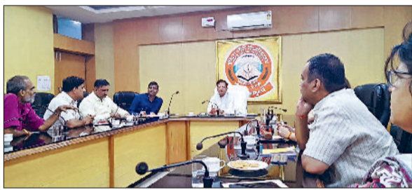
रेवाड़ी। आईजीयू में स्टाफ की बैठक लेते कुलपति।