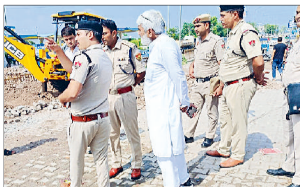
रेवाड़ी। सोहना रोड पर रैंप तोड़ने के बाद मौजूद पुलिस अधिकारी।