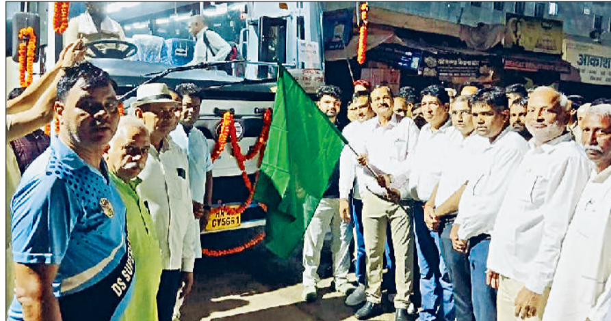
रेवाड़ी। बावल से एसी बस को चंडीगढ़ के लिए रवाना करते विधायक व एसी बस में विधायक के साथ बैठे यात्री।