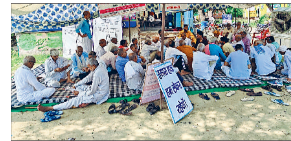
रेवाड़ी। सरकारी अस्पताल की मांग को लेकर धरने पर बैठे ग्रामीण।